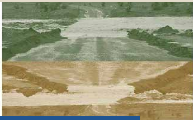
Notas do campo (2017) Catarina Boltelho 19 de mayo