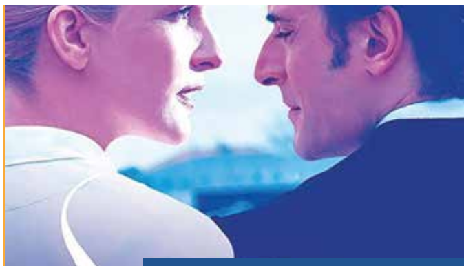
Snu (2019) Patrícia Sequeira 16 de junio